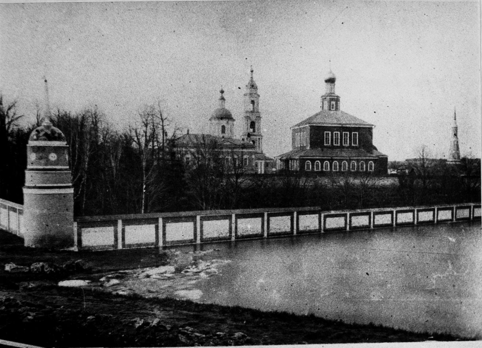
ГОЛУТВИНСКИЙ МОНАСТЫРЬ. Место нелегальных сходок 1900—1905 гг.